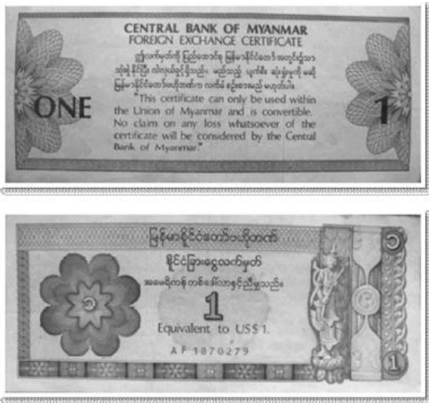
ตัวอย่าง เงินดอลลาร์สหภาพเมียนมาร์ ราคา 1 ดอลลาร์

การแลกเปลี่ยน FEC ทำได้โดยนำเงินดอลลาร์สหรัฐไปแลกที่ธนาคารหรือตลาดมืดในประเทศสหภาพเมียนมาร์ ธนบัตร FEC จะมีราคาใบละ 1 5 10 และ 20 ดอลลาร์สหภาพเมียนมาร์ โดยอัตราแลกเปลี่ยน 1 ดอลลาร์สหรัฐ เท่ากับ 1 ดอลลาร์สหภาพเมียนมาร์ เมื่อนำ FEC ไปแลกคืนจะได้รับเงินจ๊าดกลับมา