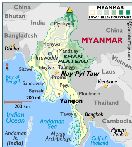
แผนที่แสดงลักษณะทางกายภาพของสหภาพเมียนมาร์